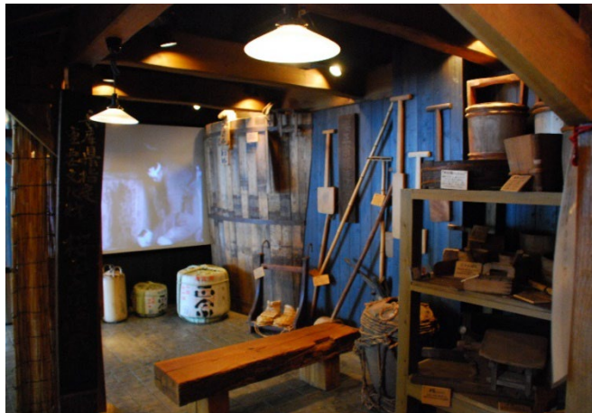
【櫻正宗記念館内 歴史資料展示コーナー】