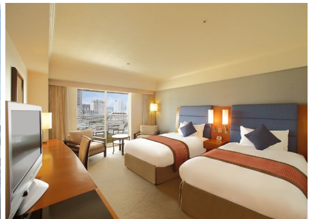
[スタンダードツイン 30.8㎡]