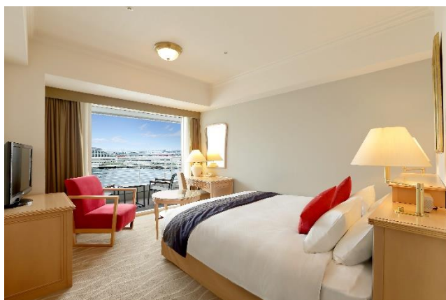
▲スタンダードダブルイーストビュー (客室一例)