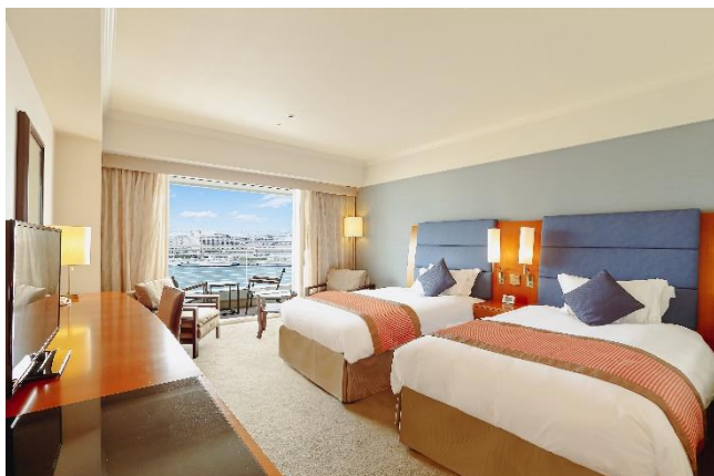
▲スタンダードツイン イーストビュー (客室一例)

●ご予約・お問い合わせ：オリエンタルホテルズ&リゾーツナビダイヤル TEL.0570-051-153 + ダイヤル①⑩