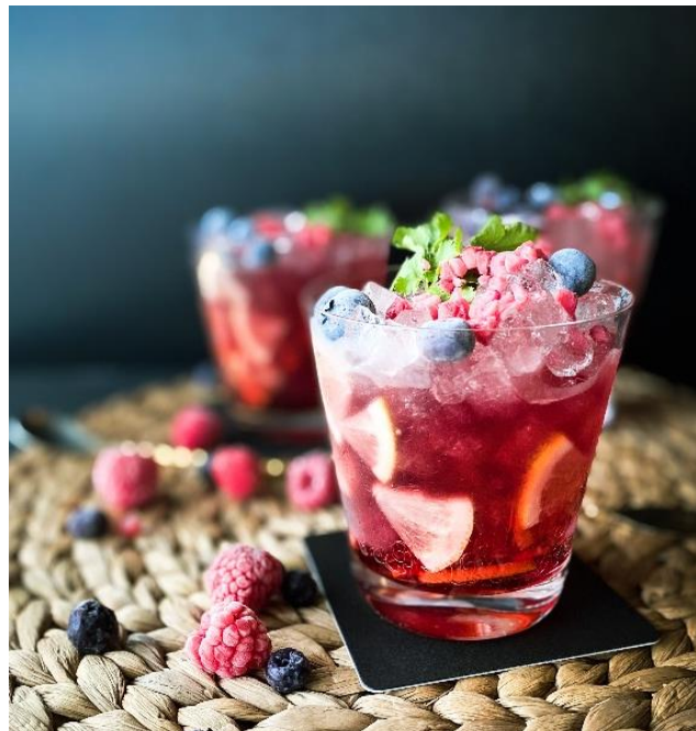
▲Berry Berry Lemon Gin & Tonic