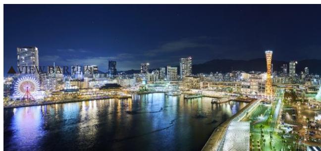
▲VIEW BAR テラス席からの夜景