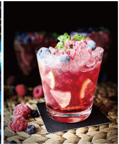
▲「メヤメヤ」オリジナルカクテル