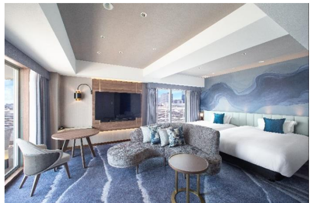
エグゼクティブルーム客室イメージ