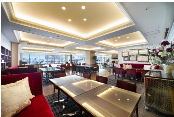
[エグゼクティブラウンジ]