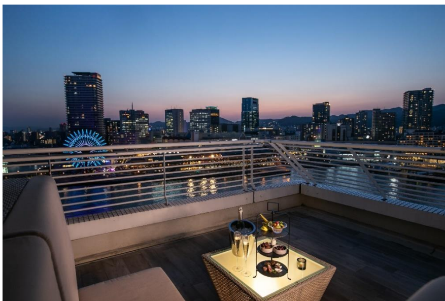
VIEW BAR テラス席 提供イメージ

周囲270度を海に囲まれた唯一無二のロケーションを誇る神戸メリケンパークオリエンタルホテルで、爽やかな潮風や心地よい汽笛の音を近くに感じながら、神戸の夜景を独り占めしているかのような贅沢な滞在体験をご提案いたします。