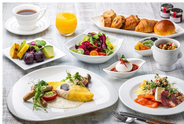
[エグゼクティブラウンジ 朝食イメージ]