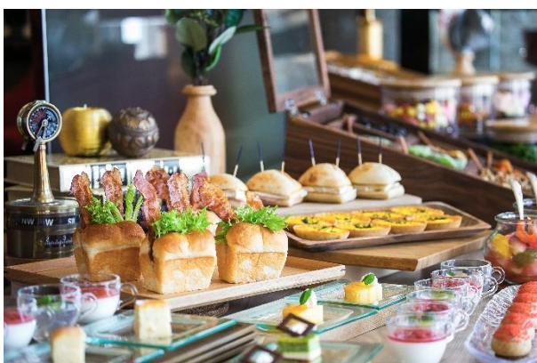
[アフタヌーンティーイメージ]