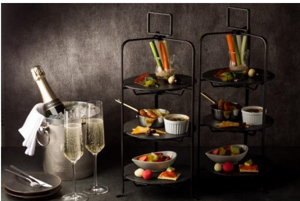
ルームサービス提供イメージ