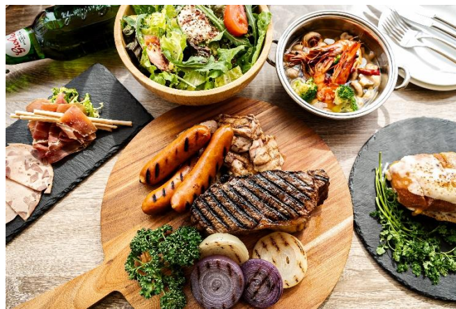
フード・ドリンクイメージ