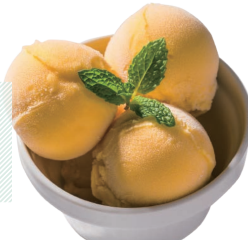
マンゴージェラート Mango Gelato