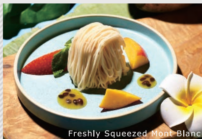
Freshly Squeezed Mont Blanc

デザートもお客様のオーダーごとに仕上げる演出を。シェフが目の前でクリームを絞って提供する「しぼりたてモンブラン」は、軽い口当たりながら濃厚な風味が広がるおすすめの逸品です。フェア期間中は、「トロピカルモンブラン」が登場！