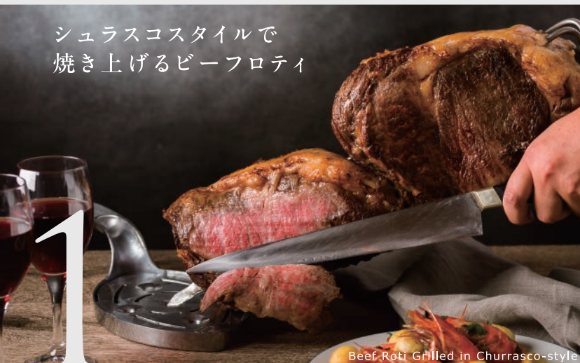
Beef Roti Grilled in Churrasco-style

ライブキッチンのイチオシメニュー！専用のロティサリーを使って素材を焼き上げ、シェフが目の前で切り分けて提供。表面の香ばしい風味、肉の旨みあふれるジューシーな味と柔らかな食感を存分にお楽しみください。