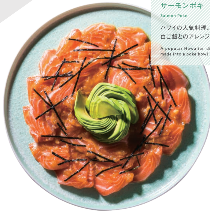
サーモンポキ Salmon Poke